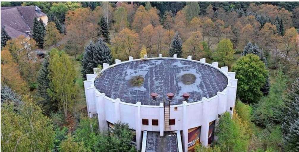
Der Verein „ISEC Wünsdorf“ stellt Donnerstag seine Visionen für das ehemals militärisch genutzte Gelände in der Waldstadt öffentlich im „Bücherstall“ vor.

Neue Ideen für die Entwicklung der ehemaligen Militärstadt stellt der Verein „ISEC Wünsdorf“ Donnerstag im „Bücherstall“ vor. Mittwoch sprach sich die Zossener Bürgermeisterin gegen die Visionen aus.